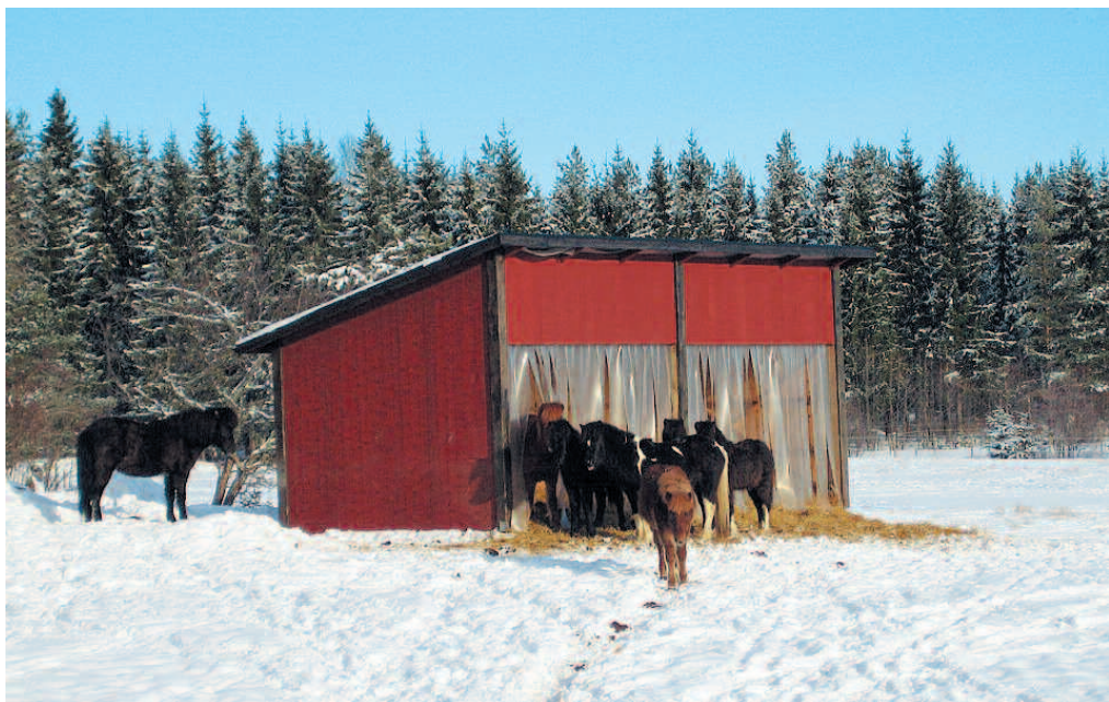
Lösdrift med ligghallen.