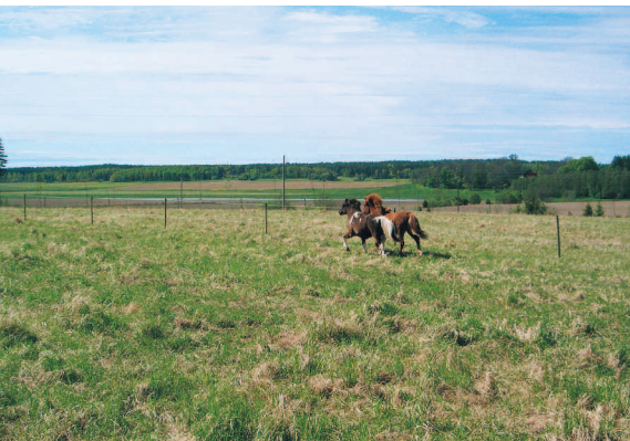
I lösdriften på Nötbacken ingår stora ytor att röra sig på med stimulerande lekmiljö och vacker utsikt!

– Kundens sätt att vilja hålla häst här på lösdrift måste överensstämja med Nötbackens policy, säger Malin. Denna innebär att hästarna har fri tillgång till grovfoder, oavsett ålder. Flocken ska