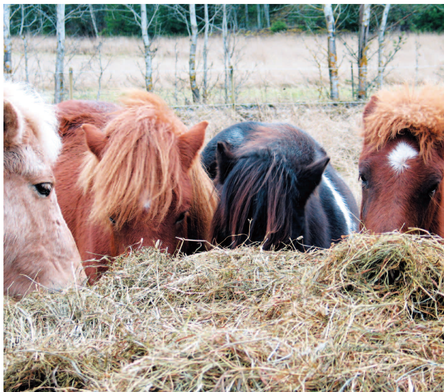
Ung som gammal samsas om grovfodret som ges i fri tillgång.